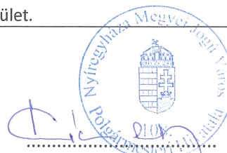
Kovács Rita városi főépítész