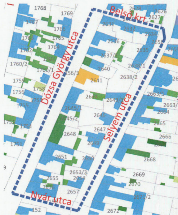
A tervezési területek alaptérképe - „Készült az állami alapadatok felhasználásával”