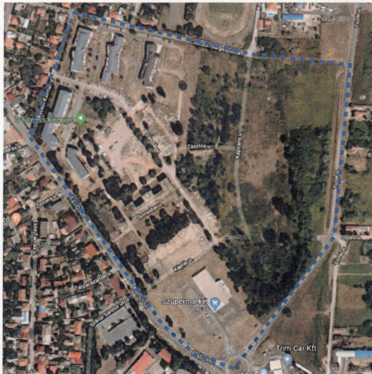
A tervezési területek ortofotója