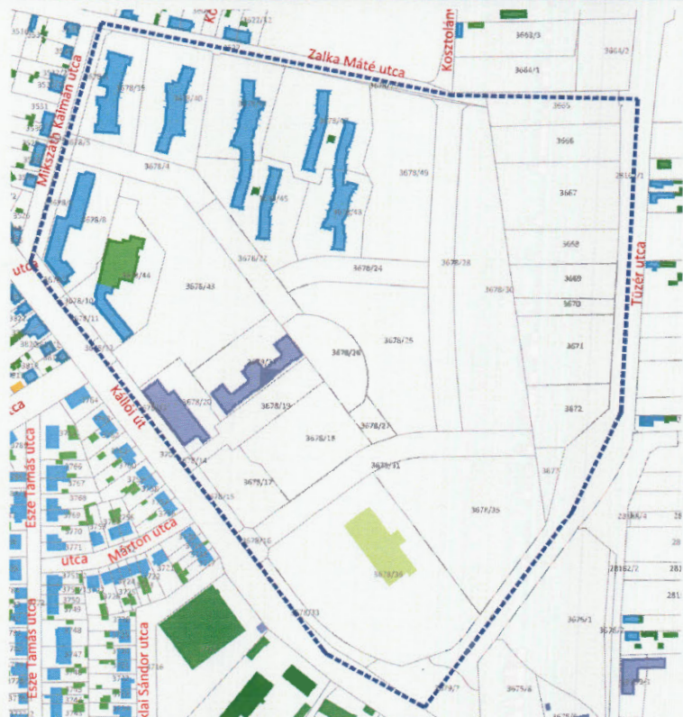
A tervezési terület alaptérképi kivonata

Ügyiratszám: FŐÉP/468-6/2019. NYÍREGYHÁZA MJV POLGÁRMESTERI HIVATALA 4401 Nyíregyháza, Kossuth tér 1. Pf. 83. Telefon: (42) 524-550 Fax: (42)310-647