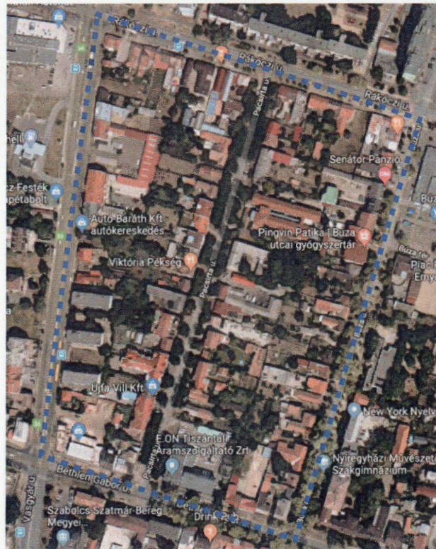
A tervezési területek ortofotója