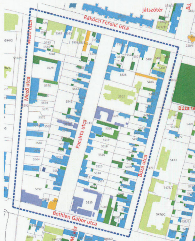
A tervezési területek alaptérképe - „Készült az állami alapadatok felhasználásával”

Ügyiratszám: FŐÉP/468-6/2019. NYÍREGYHÁZA MJV POLGÁRMESTERI HIVATALA 4401 Nyíregyháza, Kossuth tér 1. Pf. 83. Telefon: (42) 524-550 Fax: (42)310-647