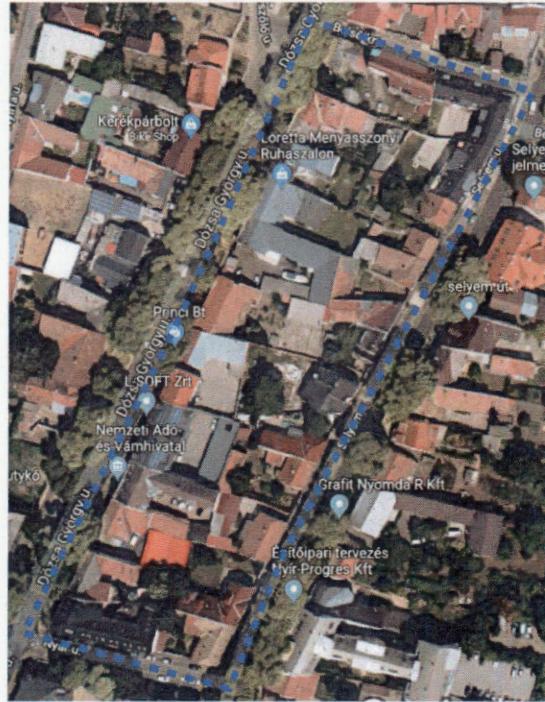
A tervezési területek ortofotója