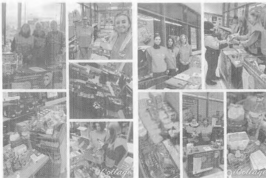
Tavaszi és karácsonyi adománygyűjtő akció

A karácsonyi tartósélelmiszergyűjtő akció sikere miatt, illetve válaszul az egyre növekvő rászoruló igényekre, 2023-ban először tavasszal is elindult a jótékonyági akció. Tavasszal is arra kértünk az embereket, hogy a nyár közeledtével is gondoljanak a nehéz sorsú embertársaikra és a hétvégi vásárlások alkalmával tegyenek egy tetszőleges tartós élelmiszert a kosarukba. Hangsúlyoztuk a közösségi összefogás erejét és azt, hogy mindenki számára van lehetőség segíteni.