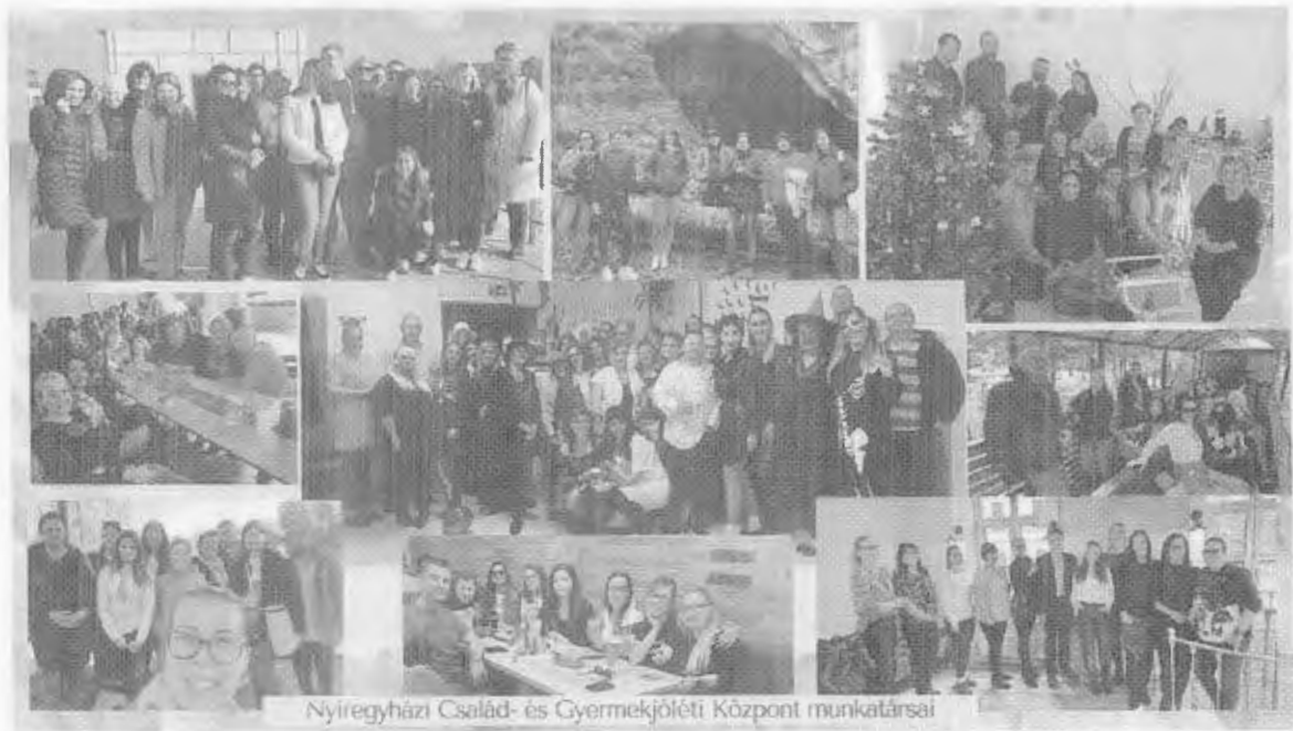
Nyíregyházi Család- és Gyermekjóléti Központ munkatársai

Intézményünk szolgáltatásairól, aktuális híreinkről honlapunkon, www.nycsgyk.hu valamint Facebook oldalunkon https://www.facebook.com/nycsgyk/ tájékozódhatnak az érdeklődők.