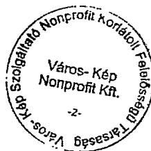
Zagyva Gyula ügyvezető