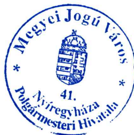
Kovács Rita városi főépítész