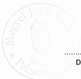
Dr. Kovács Ferenc Polgármester