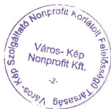
Zagyva Gyula ügyvezető